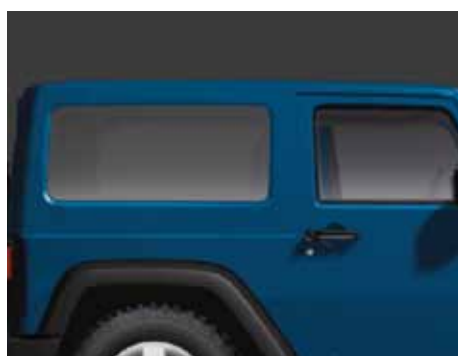
E Se muestra el de 2 puertas