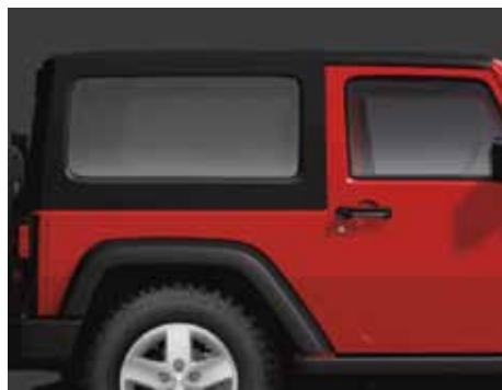
B Se muestra el de 2 puertas