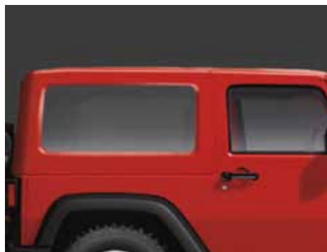
A Se muestra el de 2 puertas

El techo rígido, idéntico al techo de producción, presenta cuartos de ventana laterales de cristal tintado oscuro y un portón trasero de cristal. Incluye lavaparabrisas trasero, paneles Freedom Top y desempañador. Requiere para su instalación el paquete de cables para techo rígido si el vehículo no viene de fábrica con un techo rígido (véase listado a continuación).