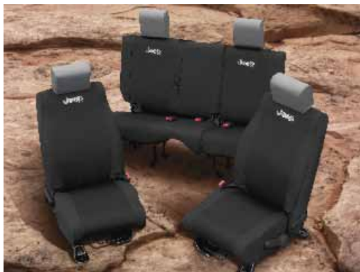
Delanteras y traseras (se venden por separado)

Las fundas para asientos están hechas a medida para un ajuste perfecto y no interfieren con los controles del asiento. Cómodas pero de tejido duradero, sirven de complemento al color del interior del vehículo al tiempo que protegen la tapicería original de la suciedad y los desgarrones. Se pueden quitar fácilmente para lavarlas y presentan el logotipo del vehículo.