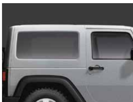
D Se muestra el de 2 puertas