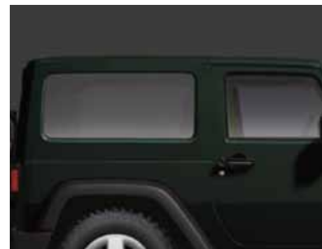
C Se muestra el de 2 puertas